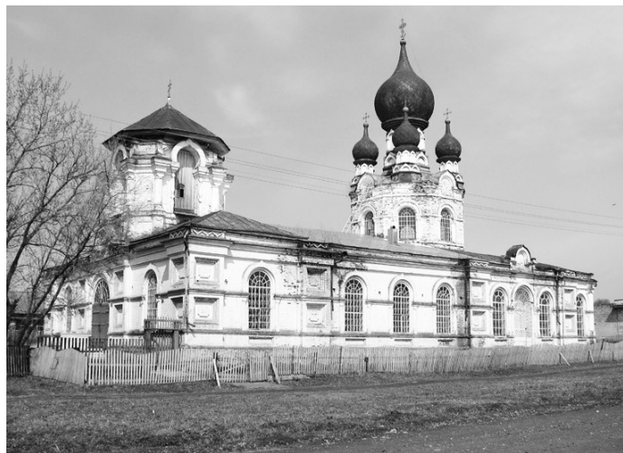
Космо-Дамианский храм с. Каракша