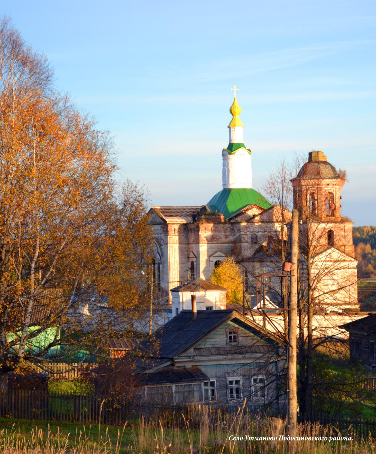
Село Утманово Подосиновского района.